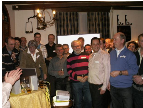
Presentatie van de kandidaten.

Veel kennis, verbonden met de gemeenschap en boordevol energie en ambitie. Dat geldt voor hen allen. Op de lijst verder veel jongeren en veertig procent van onze kandidaten is vrouw. Alle stoppende raadsleden van Combinatie95 zijn en blijven actief. Vernieuwing en continuïteit gaan dus hand in hand. Verder is er aandacht geweest voor een goede spreiding over de gehele gemeente. De helft van de kandidaten woont in Boxtel en Lennisheuvel.