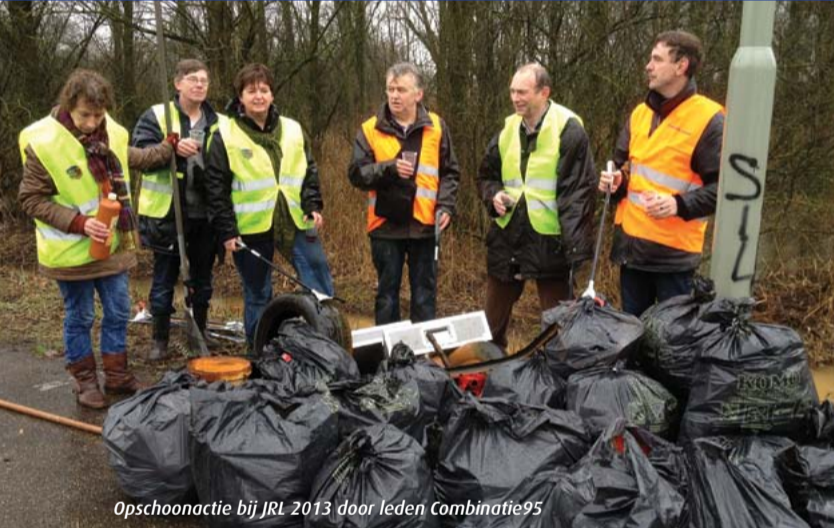
Opschoonactie bij JRL 2013 door leden Combinatie95

Als in de gemeenteraad onderwerpen aan de orde komen die in het IDOP Liempde beschreven staan is Combinatie95 paraat. Zo staan veiligheid, goed wegonderhoud en toegankelijkheid hoog op ons aandachtlijstje. Wij hebben geld geregeld om eindelijk de levensgevaarlijke oversteek bij 'Providentia' aan te pakken. De georganiseerde aanpak door SPPiLL brengt realisatie van veel zaken dichterbij en is volgens Combinatie95 een voorbeeld voor de rest van Boxtel. Naast de politiek is het belangrijk dat een gemeenschap een goede ingang heeft bij de gemeente. Met SPPiLL en 'Dorpsraad nieuwe stijl' spreekt de Liempde gemeenschap sterk via één kanaal met de gemeente Boxtel.