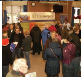
Boxtel Energie Neutraal markt

Combinatie95 pleit in de gemeenteraad steeds voor beheersing van de lasten van de burgers. Zo hebben wij sterk gestuurd op de beperking van de kosten van de ambtelijke organisatie (gedaald met 1,25 miljoen euro), maar ook hebben wij ons succesvol verzet tegen een grootschalige verbouwing van het gemeentehuis. Wij eisten in een motie dat de overschotten uit de afvalstoffenheffing terugbetaald worden aan de burgers. De invoering van Diftar per 1 januari 2014 geeft de burger de kans om met goed scheiden de afvalkosten nog verder naar beneden brengen. De OZB mag van ons niet meer dan trendmatig stijgen.