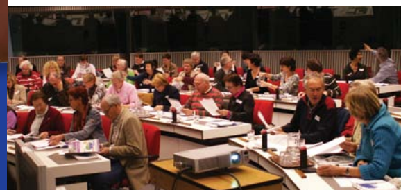
Verken je Gemeente in Brussel

Combinatie95 probeert steeds dicht bij de burgers te staan. Door al 10 jaar de interactieve cursus "Verken je Gemeente" te organiseren heeft zij ongeveer 200 burgers laten kennismaken met het doen en laten van de lokale overheid. Hierdoor ontstaat meer begrip over en weer tussen de gemeente en burgers. Ook voor een volgende cursus hebben zich al weer inwoners opgegeven. U kunt zich nog aanmelden bij p.vandewiel@home.nl. Daarnaast organiseert de partij thema-avonden op locatie, waar, naast de leden van Combinatie95, iedereen welkom is. WSD de Dommel, Wereldwinkel, gemeenschapshuis Orion, Voedselbank, Het Goed, De Rots en het Ursulagebouw zijn o.a. bezocht.