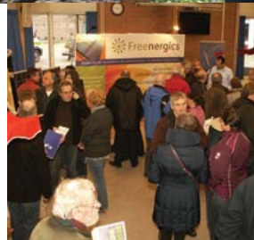
Boxtel Energie Neutraal markt