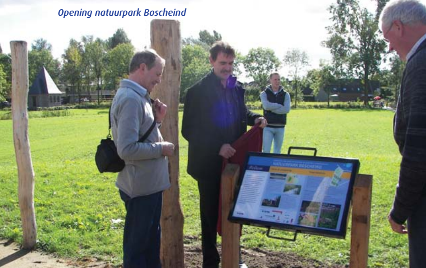
Opening natuurpark Boscheind