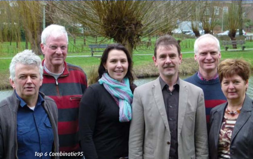
Top 6 Combinatie95

Combinatie95 streeft al jaren naar een autoluw centrum, waardoor dit aantrekkelijker wordt voor het winkelende en uitgaande publiek. Recente plannen voor een autotunnel ter plaatse van de dubbele overweg zouden nog meer doorgaand autoverkeer aantrekken via het centrum. Reden voor Combinatie95 om voor het alternatief, een omleiding van het verkeer van en naar Ladonk, te kiezen. Hierbij hebben wij wel via een amendement en motie de uitdrukkelijke eis gesteld om sluisverkeer als gevolg van de sluiting van de dubbele overweg voor auto's, tegen te gaan. Straten zoals Leenhofflaan, Parallelweg Zuid en Eindhovenseweg verdienen in de plannen extra aandacht.