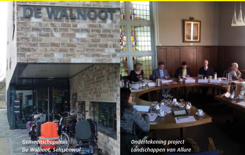
Gemeenschapshuis De Walnoot, Selissenwal

Combinatie95 pleit in de gemeenteraad steeds voor beheersing van de lasten van de burgers. Zo hebben wij sterk gestuurd op de beperking van de kosten van de ambtelijke organisatie (gedaald met 1,25 miljoen euro), maar ook hebben wij ons succesvol verzet tegen een grootschalige verbouwing van het gemeentehuis. Wij eisten in een motie dat de overschotten uit de afvalstoffenheffing terugbetaald worden aan de burgers. De invoering van Difstar per 1 januari 2014 geeft de burger de kans om met goed scheiden de afvalkosten nog verder naar beneden brengen. De OZB mag van ons niet meer dan trendmatig stijgen.