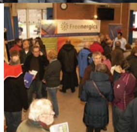
Boxtel Energie Neutraal markt

Zorgtaken worden in het kader van de Wet Maatschappelijke Ondersteuning (WMO) door het Rijk neergelegd bij de gemeenten. De capaciteit van veel gemeenten schiet tekort om al deze en andere taken op een kwalitatief goede manier uit te voeren. Daartoe zal ook Boxtel intensief moeten gaan samenwerken met andere gemeenten. Combinatie95 heeft een voorkeur voor omliggende Meierijgemeenten, maar vindt dat de burgers betrokken moeten worden bij de definitieve richting die we kiezen. Wij sluiten daarbij geen enkele optie uit.