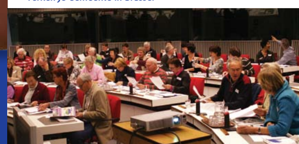
Verken je Gemeente in Brussel

Combinatie95 probeert steeds dicht bij de burgers te staan. Door al 10 jaar de interactieve cursus "Verken je Gemeente" te organiseren heeft zij ongeveer 200 burgers laten kennismaken met het doen en laten van de lokale overheid. Hierdoor ontstaat meer begrip over en weer tussen de gemeente en burgers. Ook voor een volgende cursus hebben zich al weer inwoners opgegeven. U kunt zich nog aanmelden bij p.vandewiel@home.nl. Daarnaast organiseert de partij thema-avonden op locatie, waar, naast de leden van Combinatie95, iedereen welkom is. WSD de Dommel, Wereldwinkel, gemeenschapshuis Orion, Voedselbank, Het Goed, De Rots en het Ursulagebouw zijn o.a. bezocht.