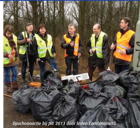
Opschoonactie bij JRL 2013 door leden Combinatie95